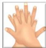
2. Paume contre dos Doigts et espaces interdigitaux