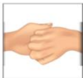
4. Paume et doigts