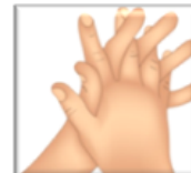
3. Doigts entrelacés Doigts et espaces interdigitaux